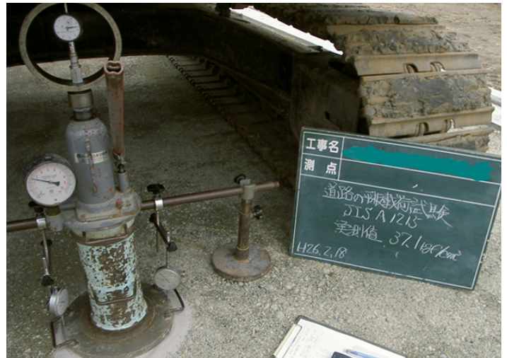
道路の平板荷重試験 (JIS A 1215)