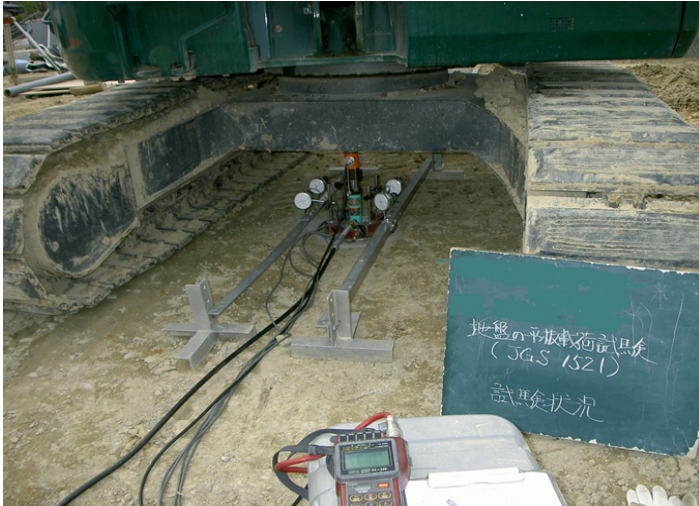
平板荷重試験 (JGS 1521)