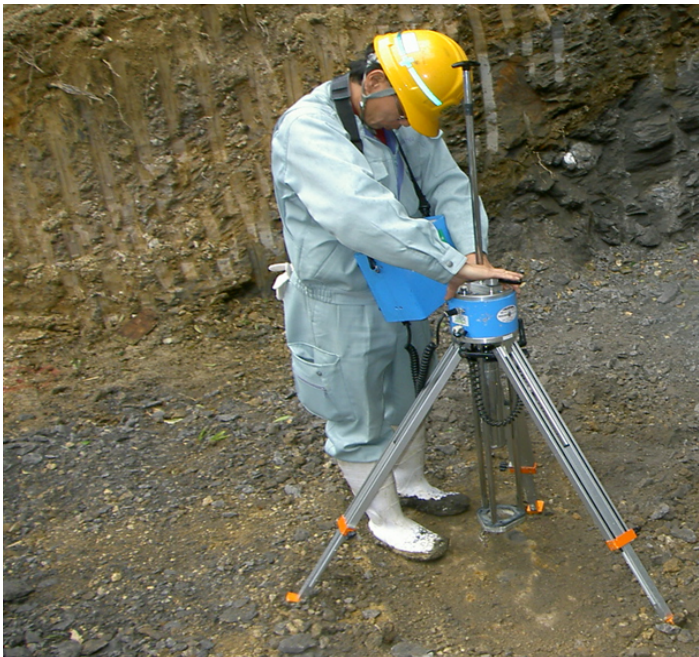
簡易支持力測定 キャスポール