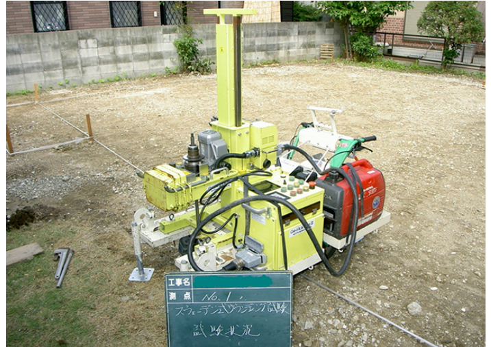
スウェーデン式サウンディング試験 (JIS A 1221)