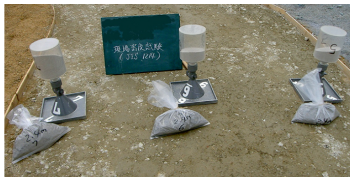
砂置換法による土の密度試験 (JIS A 1214)